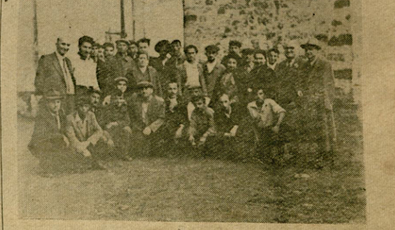
სურათში: ექსპურსანტები კახს ქართული საშუალო სკოლის ენობა ინფორმაციო- ქართულებთან ერთად.

ლასთან და კარგი სამუშაოები გავცხავთ. დღეს ინფორმაციო-ქართულები მომე- პოვებიათ რუსებლებში მშვიდლად და ბედნიერად ცხოვრობენ. ბოლო მოე- ლო ინფორმაციის სოციალურ-ეროვნულ ჩვენებს. საინფორმაციო წარმეტყველებს ახლა ფართოდ არის ჩამოსული ახალი სო- ციოლოგიური მეცნიერების ფორმული და ენათა უნივერსიტეტის მიმართობის რობებში მასწავლებლებს ალექსი 8. ბილიძე