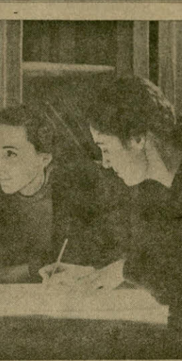
სტუდენტების ლოკომობილი სტუდენტების...