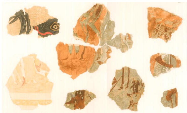
5. 1886 წელს ცუნდასის მიერ აღმოჩენილი მიკენური ფრესკის ფრაგმენტები.

ხაზგასმით უნდა აღინიშნოს, რომ იმის თქმა, თითქოს ბერძნებმა მიკენურ პერიოდში, ძვ. წ. პირველ ათასწლეულამდე ცხენის ჭენება იცოდნენ, 552 არამეცნიერულია. დამოწმებულ მეცნიერთა მიერ ამის დასაბუთება ზოგ შემთხვევაში საოცრად მიკიბმოკიბულ წარმოსახვაზეა აგებული, დანარჩენ შემთხვევაში კი უბრალოდ თვალეში ნაცრის შეყრას, სინამდვილის გაყალბებას და მათი სურვილის სიმართლედ გასაღებას ჰგავს. კერძოდ, ისინი იმოწმებენ უაღრესად ფრაგმენტულად შემორჩენილ ერთ მიკენურ ფრესკას, უფრო სწორად, მისი აღდგენის ერთ-ერთ ვერსიას. 553