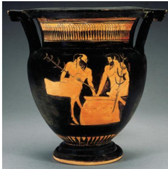
12. წითელფიგურული კრატერი, ატიკური, ძვ. წ. 480 – 470 წწ. კერძო კოლექცია.

გასათვალისწინებელია ერთი დეტალიც: ბალახი კენტავრიონი, რომელსაც სახელი მითიური ცხენკაცების მიხედვით უწოდეს ძველმა ბერძნებმა, სამკურნალო იყო, მაგრამ კენტავრიონის ძირს ჩრდილშიც ახმობდნენ და ღვინოს უკეთებდნენ საამო სურნელის მისანიჭებლად. ეს იმაზე მეტყველებს, რომ მითში კენტავრებმა კარგი ღვინის დაყენება იციან, წინააღმდეგ შემთხვევაში, მათი სახელი ამ მცენარეს არ ეწოდებოდა. 588