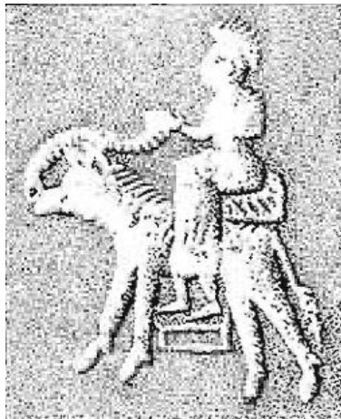
2. ქანიშში აღმოჩენილი ბეჭდის გამოსახულება, ca. ძვ. წ. 2000 წ.

პირველ რიგში, რითი ვამტკიცებთ, რომ ბეჭედი ხეთი ხელოსნის გაკეთებულია და არა ხათის ან რომ გამოსახულება ხათურ ან სხვა ხალხის ყოფაზე არ მიგვითითებს, ხეთი ადამიანის მიერ რომც იყოს დამზადებული?