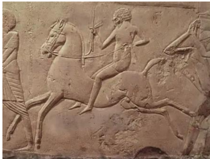
3. ეგვიპტური რელიეფი, ძვ. წ. 1332 – 1323 წწ.

ადგილმდებარეობა ჩვენთვისაც უცნობია, რაც გარკვეული დეტალების გადამოწმების საშუალებას არ იძლევა. შულმანის მიერ დამოწმებული მეთვრამეტე დინასტიის გვიანდელი პერიოდის არტეფაქტებიდან მეორეზე, კირქვის ჩაღრმავებული რელიეფის ფრაგმენტზე, 542 წარმოდგენილია ბოლონიის არქეოლოგიურ მუზეუმში დაცული ბარელიეფის 543 გამოსახულების ზუსტი, მაგრამ შელამაზებული ასლი, რის გამოც იგი ნაყალბევად, მეცხრამეტე-მეოცე საუკუნეში დამზადებულად მიგვაჩნია. 544