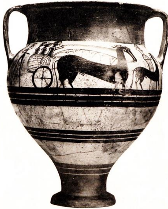
7. კრატერი კვიპროსიდან კვიპროსულ-მინოსური წარწერით, ძვ. წ. 1300 – 1250 წწ. ამსტერდამი, ალარდ პირსონის მუზეუმი, ინვენტარის ნომერი 1856.

კელდერი და იქვე ფრჩხილებში დასძენს: „though this interpretation is highly speculative“. დავუშვათ, რომ მიწაზე მდგარი ეს კაცი მიწაზე კი არ დგას, არამედ ცხენზე ზის: რაკი კრატერზე გაუშიფრავი კვიპროსულ-მინოსური დამწერლობით შესრულებული წარწერაა, ცხადია, მხატვარმა ეს უცნობი, არაინდოევროპული ენა იცოდა.