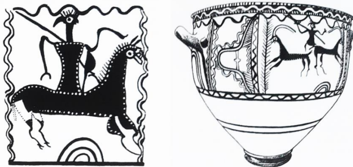
8. კრატერი მულიანადან. პერაკლიონი, არქეოლოგიური მუზეუმი.

პარალელი უჭერს მხარს ამ ფიგურების მხედრებად მიჩნევას? თუკი ცხოველებს ხარებად არ მივიჩნევთ ოდნავ მოგრძო ყელის გამო, რითი ვასაბუთებთ რომ ისინი ჯორები, ჯორცხენები ან ვირები არაა? მათ კისერზე უფრო მოკლე სიგრძის ფეხები აქვთ, თვალშისაცემია ზოგიერთი მათგანის საოცრად გრძელი ყურებიც თუ რქებიც. მათი ცხენებად ჩათვლა უფრო სურვილს ჰგავს ვიდრე დასაბუთებულ შეხედულებას. ყველა დამოწმებულ მასალაზე შეჩერება შეუძლებელია, თუმცა ხაზგასმით უნდა აღინიშნოს, რომ არცერთი მათგანი და დღეისთვის ცნობილი არავითარი მასალა არ მოწმობს იმას, თითქოს ძველმა ბერძნებმა ძვ. წ. მეორე ათასწლეულში ცხენის ჭენება იცოდნენ. მეტიც, კრეტაზე, სოფელ მულიანაში აღმოჩენილი გეომეტრიული პერიოდის ლარნაკის გამოსახულებაც კი, 564 რომელზეც, ზოგიერთი მეცნიერის აზრით, ძვ. წ. პირველი ათასწლეულის პირველ ბერძენ მხედარს ვადასტურებთ, მხედრის გამოსახულებად ვერ ჩაითვლება. 565