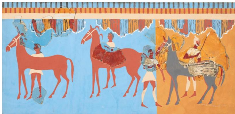
6. 1886 წელს ფრაგმენტული სახით აღმოჩენილი მიკენური ფრესკის აღდგენის ერთ-ერთი ვერსია.