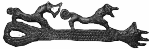
6. ბრინჯაოს საკიდი ყოზანიდან, ი. დომანსკის მიხედვით