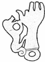
5. ბრინჯაოს საკიდი ჩრდილო კავკასიიდან (ყოზანი) ა. მიღერის მიხედვით