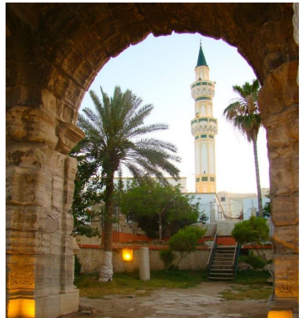
ილუსტრაცია 15. გურჯის მეჩეთი ქალაქ ტრიპოლიში