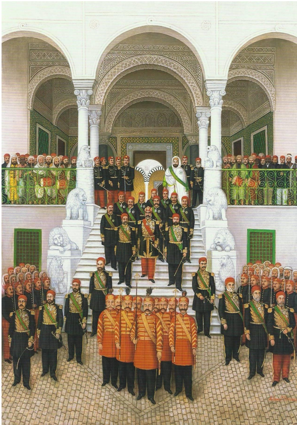
ილუსტრაცია 6. Ahmed Osman, La Descente des Marches. ნახატი შექმნილია 1876 წელს, ცენტრში, მმართველის წინ, გვერდით და უკან ვხედავთ მამლუკებს.